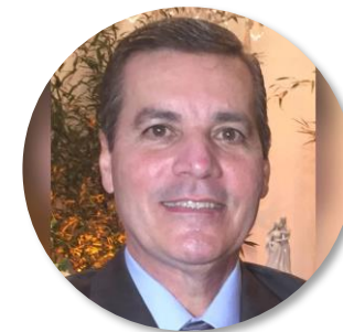
General Sidnei Prado